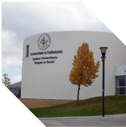
Campus de Soria