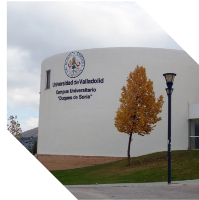
Campus de Soria