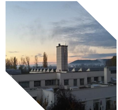
Campus de Palencia