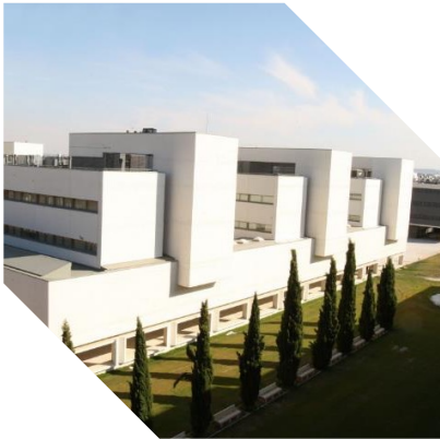
Campus de Valladolid