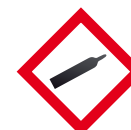
Bombona de gas