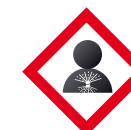
Peligro para la salud