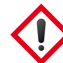
Atención (irritante o nocivo)