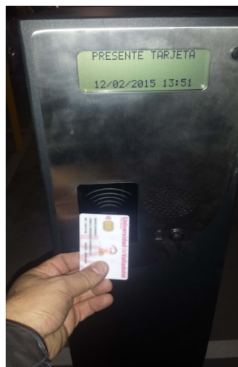
Lector de la empresa adjudicataria

Dentro del aparcamiento, nos encontraremos con dos tipos de lectores: los correspondientes a la empresa adjudicataria de la gestión del aparcamiento y los lectores UVa. En ambos casos son inalámbricos, si bien el lector UVa presenta la tradicional ranura de inserción con la que esperamos se facilite la detección inalámbrica de la tarjeta.