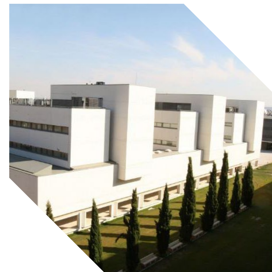
Campus de Valladolid