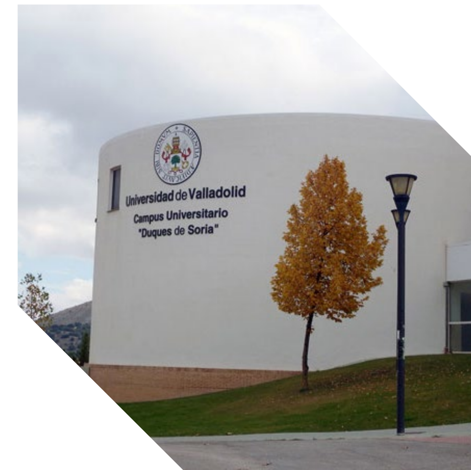
Campus de Soria