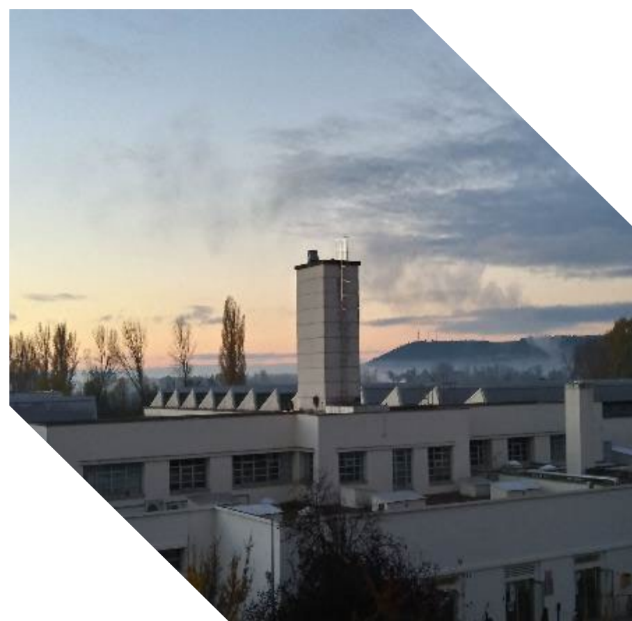
Campus de Palencia