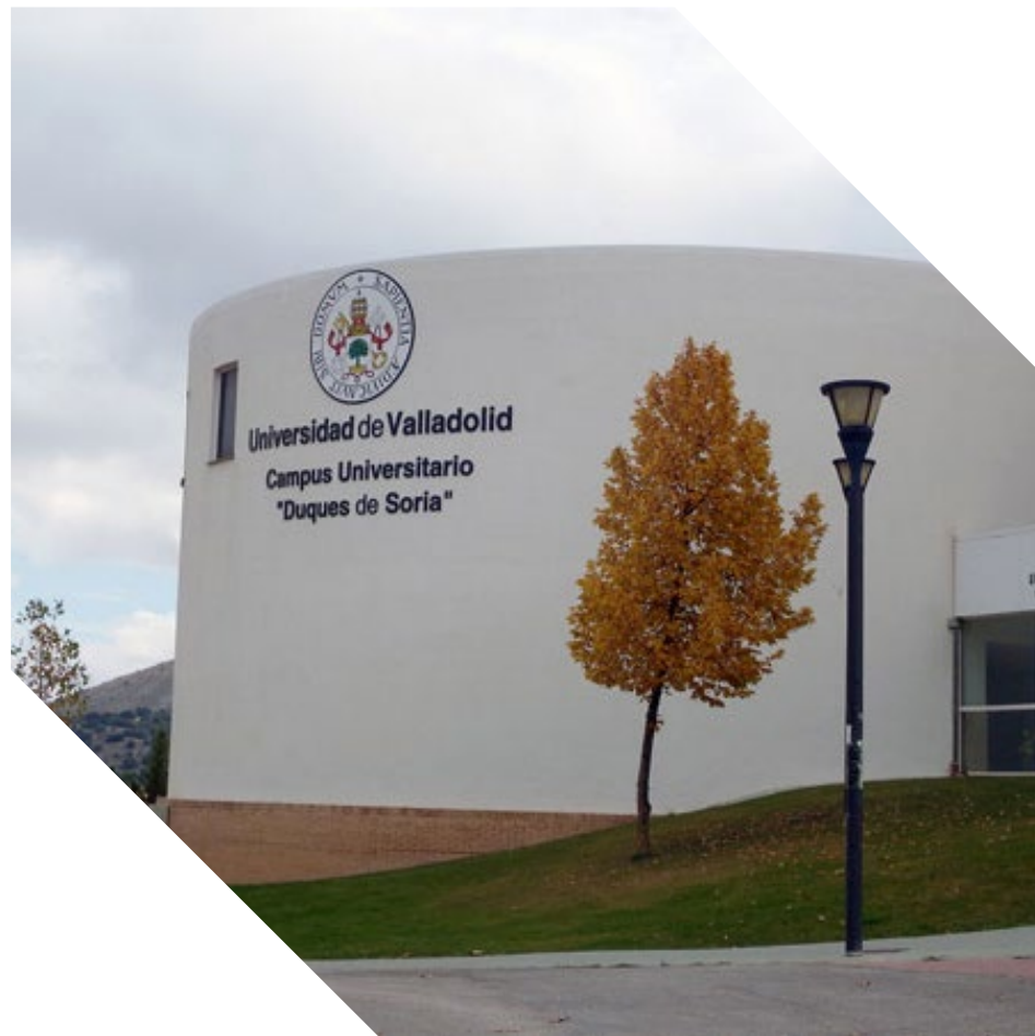
Campus de Soria