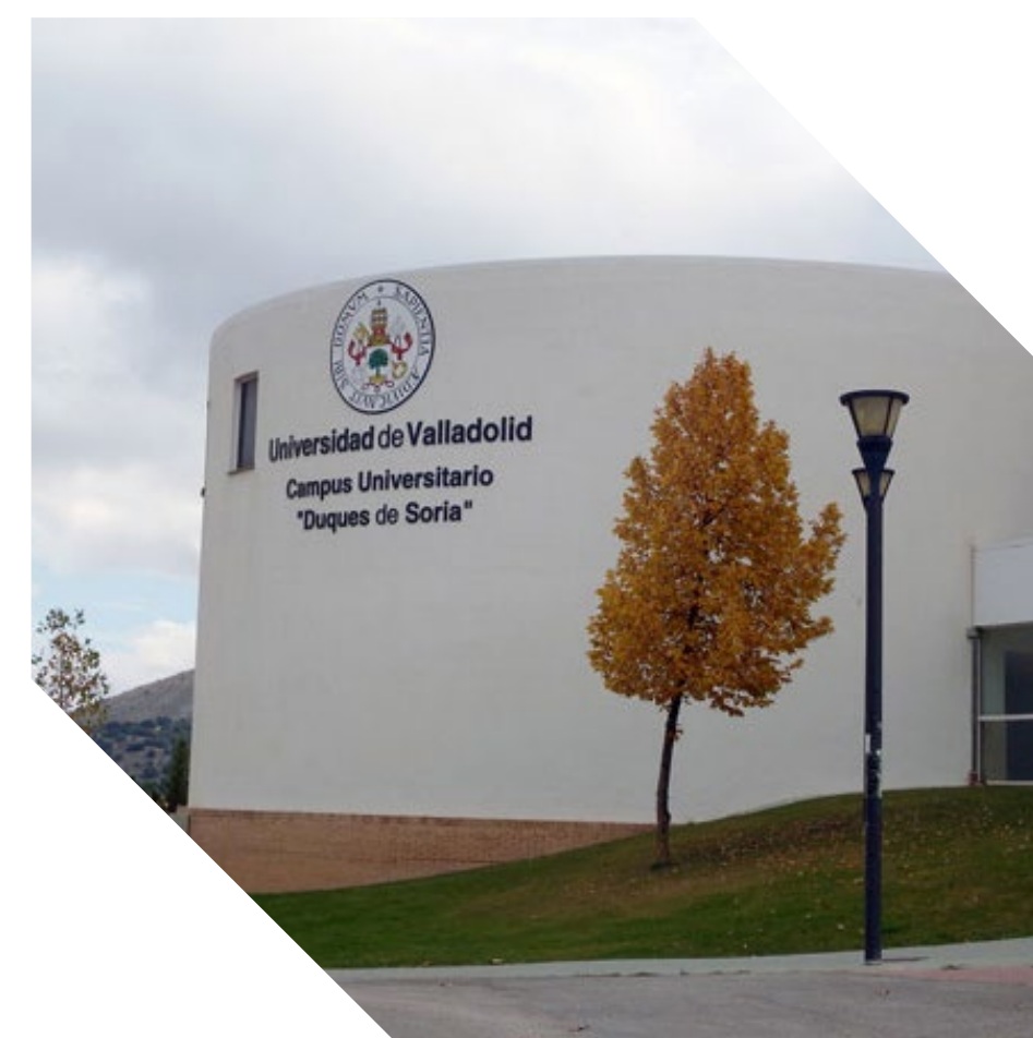
Campus de Soria