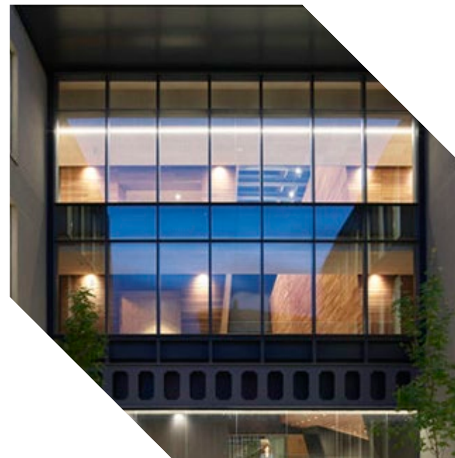
Campus de Segovia